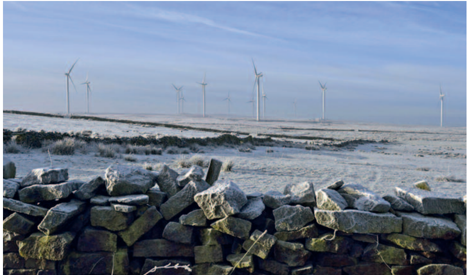
Beim Windpark Hyndburn rechnet Energiekontor mit 78 Millionen Kilowattstunden Windstrom im Jahr. Das reicht aus, um den Bedarf von 20.000 Haushalten zu decken.

Acht Windräder mit einer Gesamtleistung von 18,5 Megawatt sollen sich bald auch in Withernwick drehen. Der Standort befindet sich in der Grafschaft Yorkshire, wo schon seit ein paar Monaten kräftig gebaut wird. Die Inbetriebnahme der Anlagen dürfte in Kürze erfolgen. Withernwick gehört wie Hyndburn zu den konzerneigenen Windparks von Ener-